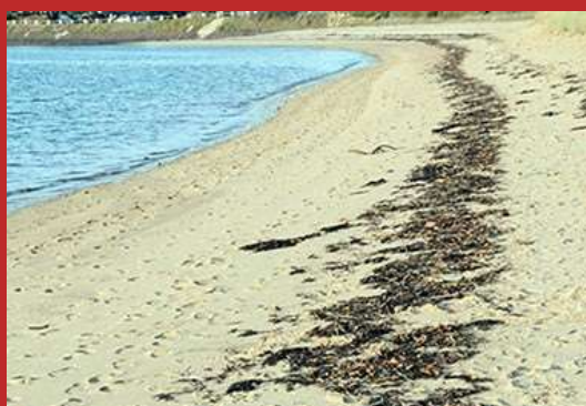
Laisse de mer