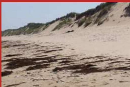
Pied de dune